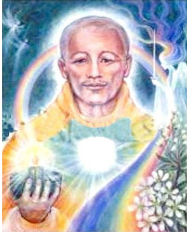
DJWAL KHUL – RAYO VERDE

Djwal Kul: El maestro Ascendido Djwal Kul es un Maestro de Amor. Su retiro Etérico localizado en el Tíbet, es un foco de la iluminación para asistir a la conciencia de la India y a los maestros de los Himalayas. Djwal Kul nos invita a acudir a su retiro a estudiar el yoga divino, la ciencia de la reunión con Dios. Aquí, nosotros estudiamos el aura humana y meditamos en la cámara secreta del corazón, entonces nosotros podemos infundir amor divino en cada cosa que hagamos. Djwal Kul también enseña a sus estudiantes el reloj cósmico, una elevada astrología de los maestros Ascendidos, y como invocar las llamas de Dios para superar condiciones kármicas negativas